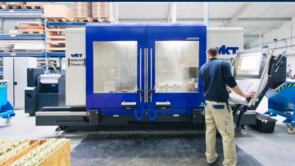
Das Material GFK ist mitunter ein Fall für die Schwerzerspannung und wird hier auf dem Schwenkspindelbearbeitungszentrum Tiltenta 6 2300 bearbeitet.