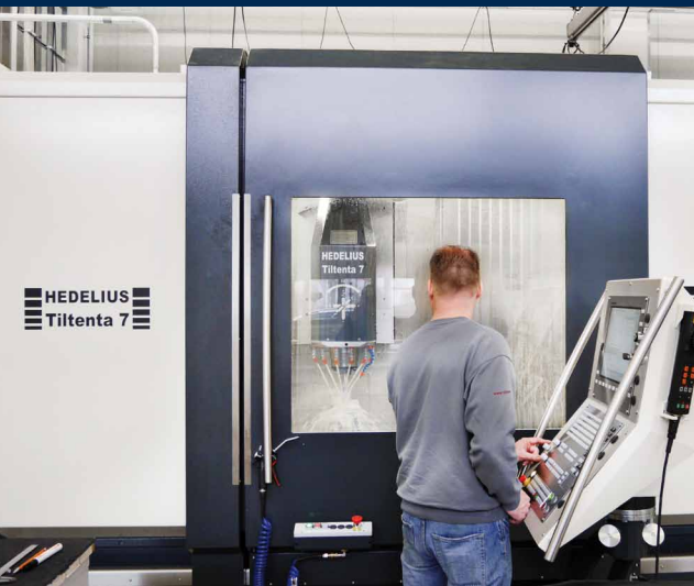
D+P usine principalement des pièces en aluminium sur le centre HEDELIUS TILTENTA 7 Single.